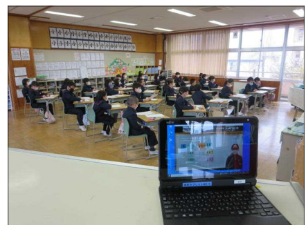
授業参観の様子（3年生）

先週の25日（木）、26日（金）は、授業参観・懇談会にご参加いただきありがとうございました。1学期末の分散型授業参観は、新型コロナウイルス感染症による出席停止の影響で、3日目（出席番号21番以降）の授業参観が実施できませんでした。お子さんの様子をご覧になれずさぞ残念であったことと思います。この反省を踏まえ、今回のPTA授業参観は、たとえ学年学級が出席停止となっても、他の学年学級の参観は実施できるようにと、オンラインで実施しました。音声が少し乱れてしまった部分もありましたが、お子さんの普段の学習の様子を感じていただけたのではないのでしょうか。