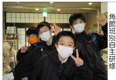
角館班別自主研修